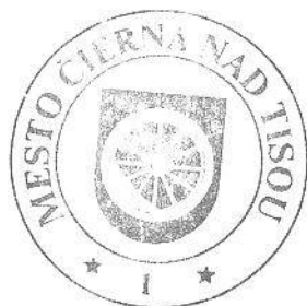
Ing. Viktor Palko, MBA primátor mesta

https://www.enviroportal.sk/sk/cia/detail/adaptacna-strategia-na-dosledky-zmeny-klimy-v-košickom-kraji